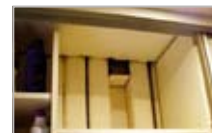
Přívodní vzduchovod ve skříni

Jednotku je vhodné umístit např. do prostoru šatní skříňe. Lze použít oba základní typy jednotek (nástěnné i podstropní).